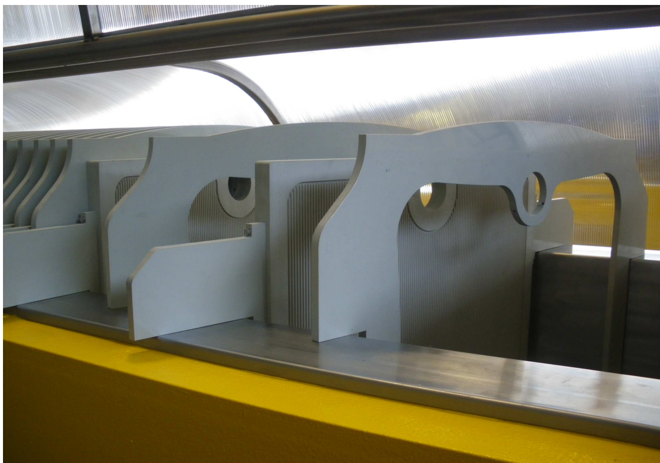
Фильтр-пресс с картридж-картоном для фильтрации синтетических масел

Во всех этих случаях использование фильтра обязательно, в особенности во время использования замкнутого водооборота в станках. По заказу могут быть отдельно рассмотрены различные применения.