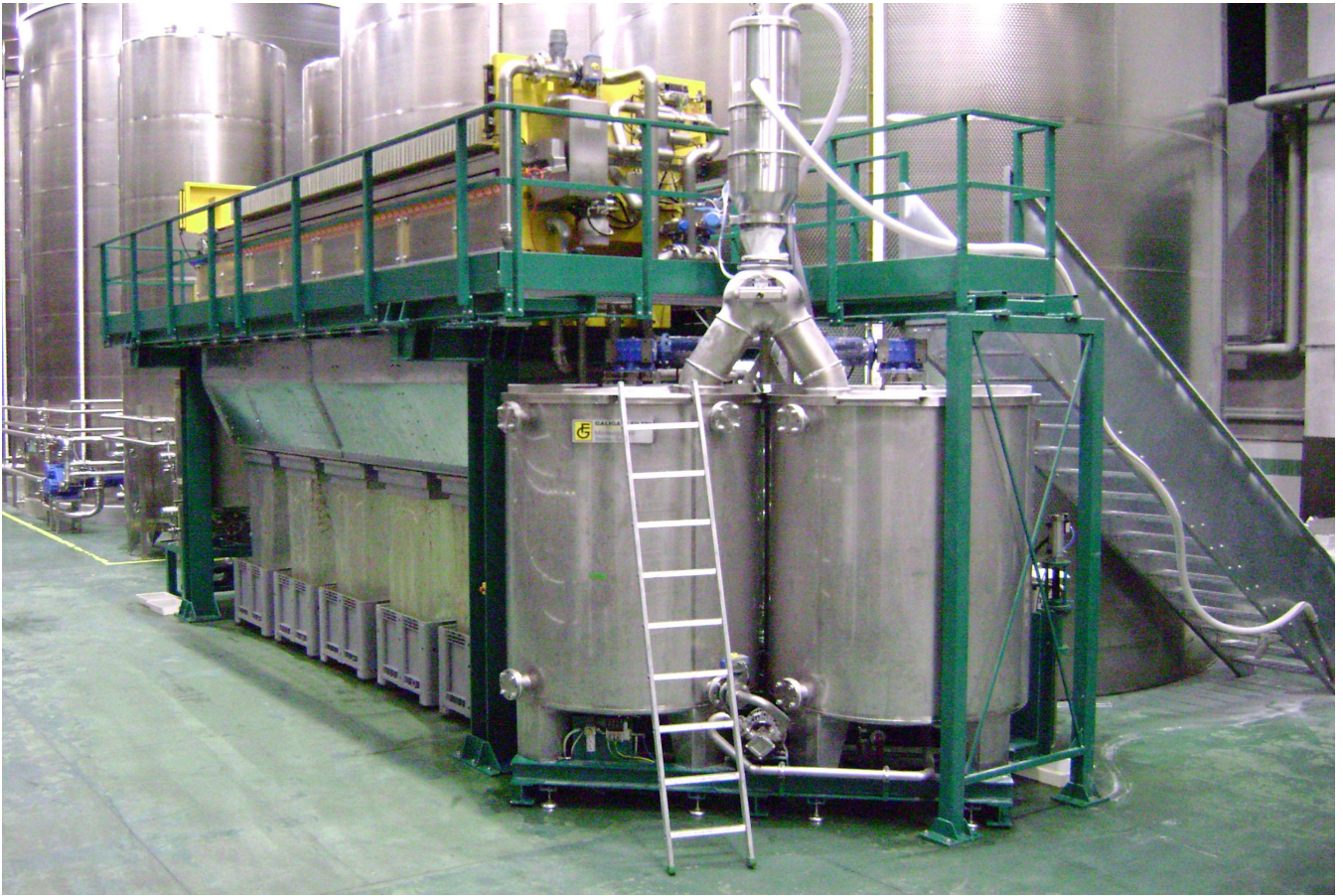
Оборудование DIATOM с фильтр-прессом для фильтрации оливкового масла первого отжима с использованием диатомовой земли.