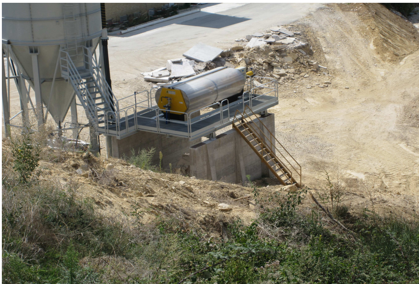
Физико-химическое оборудование, предприятие по обработке камня, Италия

Другой тип инертных материалов представлен в процессе мойки песка и мелкого гравия, которые производятся в дробильных установках. Это оборудование представлено практически повсеместно, но более всего в странах с процветающей строительной индустрией. Песок и мелкий гравий действительно имеют существенно важное значение в строительстве железобетонных конструкций и должны быть вымыты и очищены, чтобы лучше присоединяться к цементу.