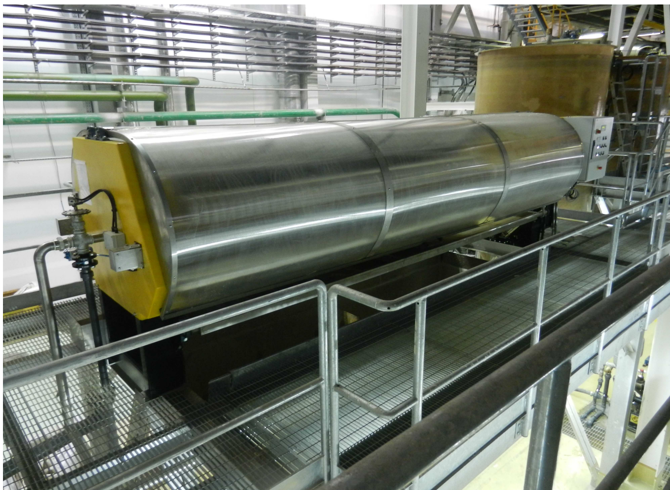
Фильтр-пресс, установленный в очистном сооружении на покрасочной линии. Автомобильная индустрия, РФ г. Самара

Как правило, существует два типа очистительного оборудования: Биологическое и Физико-Химическое. Оборудование биологического типа обычно используется для