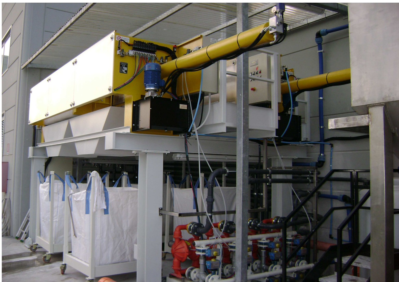
Физико-химическое оборудование, предприятие по производству стекла, Италия

Этот процесс предусматривает оборудование, сходное с тем, что используется для инертных материалов (см. выше), но в отличие от них, имеют наименьшие загрузки, и таким образом, декантаторы гораздо меньших размеров.